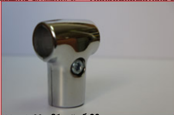
Описание: 00, 26х труб 90