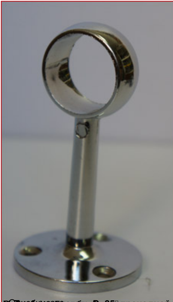
Вид с обратной стороны D=25 проходной