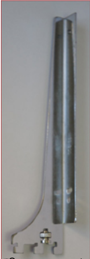
Радион-Прим 20005 рублей Кронштейн на перфорацию M32(правый), M33(левый)