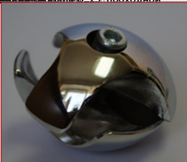
Правый, L-001/R(TH-01-2)правый, 3-х труб L-001/R(TH-01-2)правый, 3-х труб