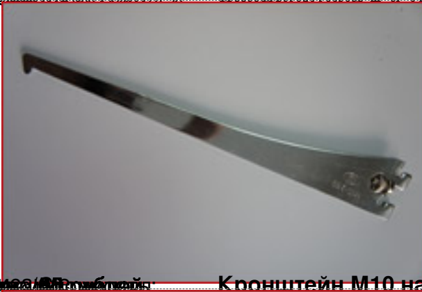
Цена 25 рублей Кронштейн M10 на перфорацию