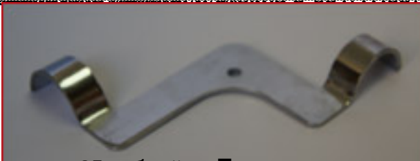
Описание: 05 трубей Полкодержатель для стекла и панели UNO-025(TH-108)