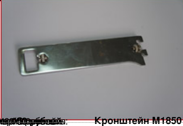
Цена 100 рублей Кронштейн M1850 на перфорацию