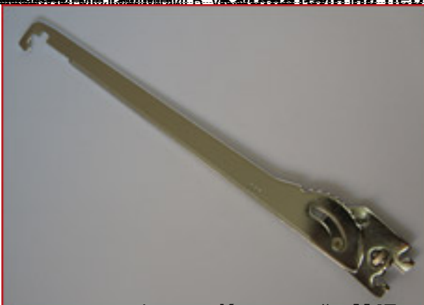
Радион-Прим 20005 рублей Кронштейн M47 на перфорацию