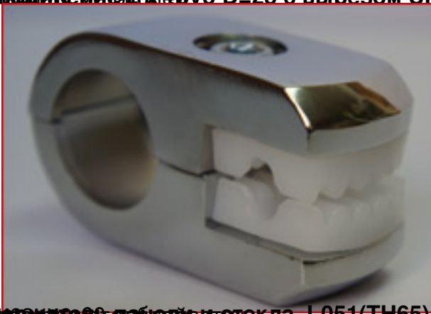
Описание: 00, лаза и стекла J-051(TH65)