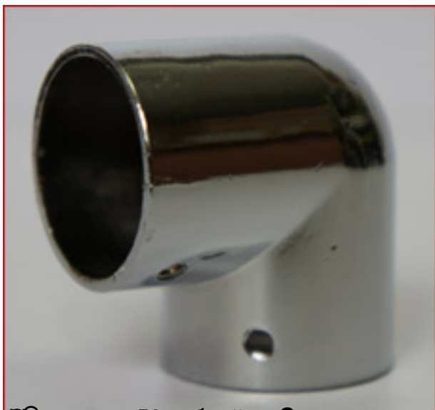
Цена 50 рублей Соединитель 2-х труб D=25 Г-образный