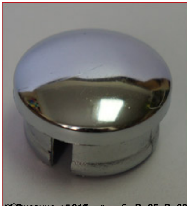
Сопло из нержавеющей стали к трубе D=25, D=32