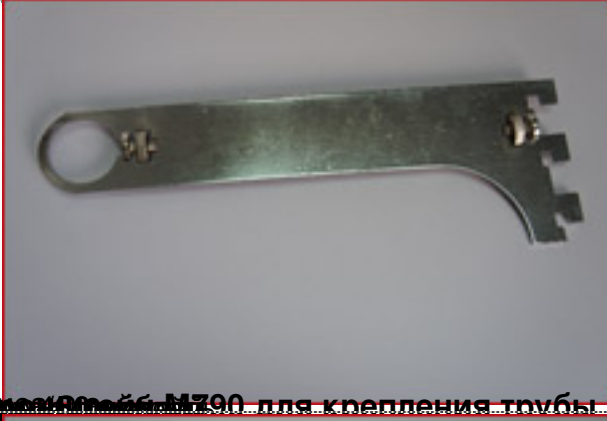
Цена 100 рублей Кронштейн M790 для крепления трубы D=25 на перфорацию