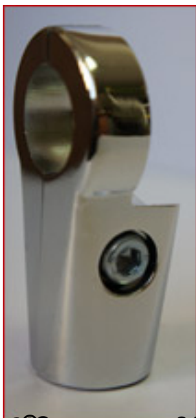
Описание: 00, 26х40, 6 D=25 с вырезом UNO-022